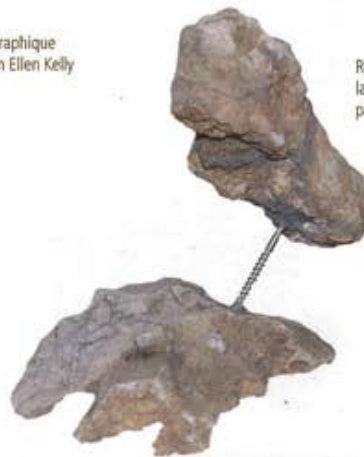
Recherche autour de la pierre de Cassis par Alaa Abdelhamid