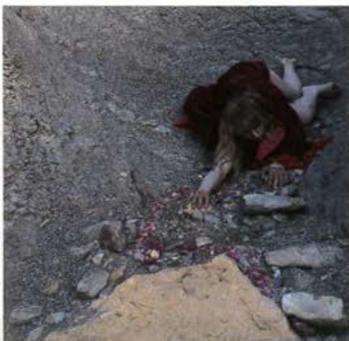
Œuvre chorégraphique signée par Erin Ellen Kelly